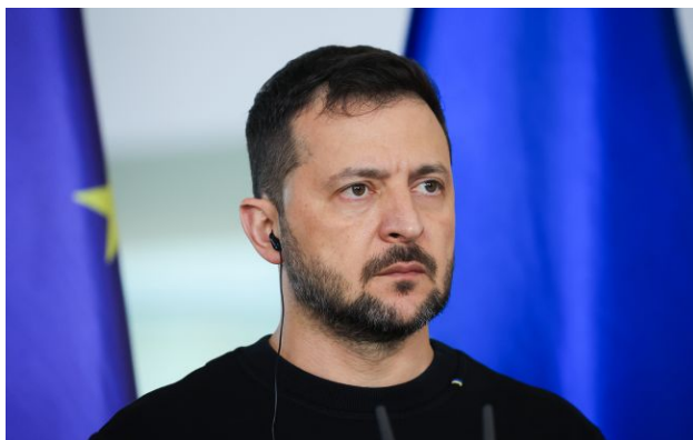
Фото: президент України Володимир Зеленський

Президент України Володимир Зеленський заявив, що припущення про те, що РФ відмовиться від нового наступу через страх перед американським президентом Дональдом Трампом, не є достатньою гарантією безпеки.