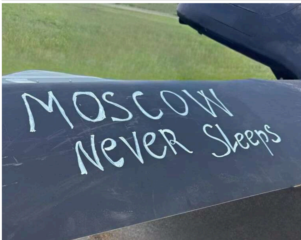
Реакція на удари по Москві: в ISW пояснили, чому Кремль применшує наслідки атаки, а Z-блогери обурені

Удари Сил оборони України по Москві і Московській області 17 травня продемонстрували, що Росія не здатна надійно захистити навіть власну столицю. Це усвідомлення вже спричинило хвилю розчарування у Z-середовищі.