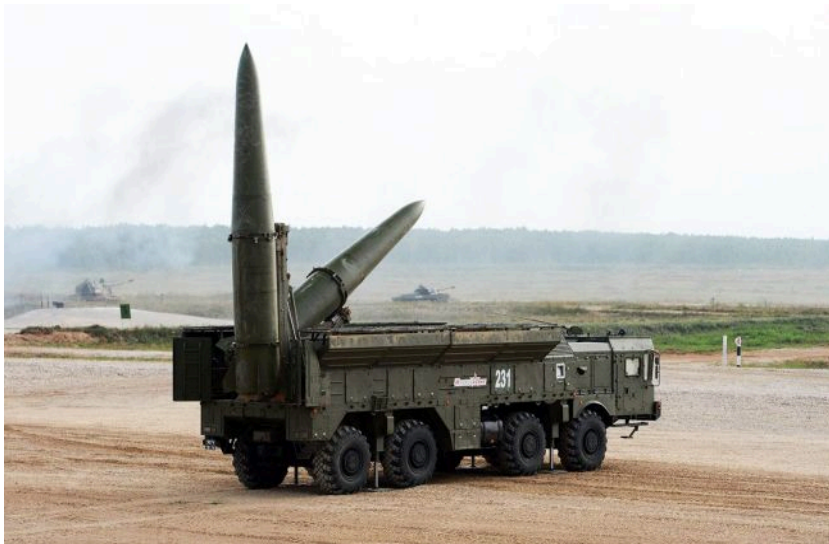
Фото: як ППО впоралась з ракетами та дронами