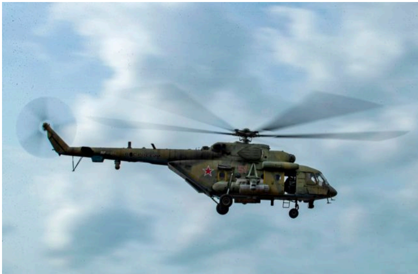
Фото: російський гелікоптер