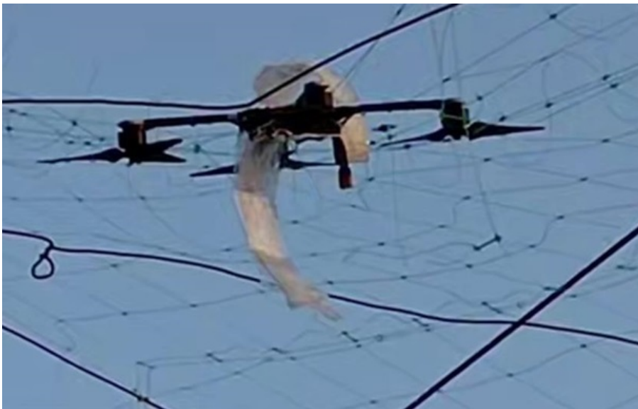
Фото: Скриншот відео Антидронові сітка

Державна спеціальна служба транспорту виконуватиме роботи з ремонту та антидронових захисту таких доріг.