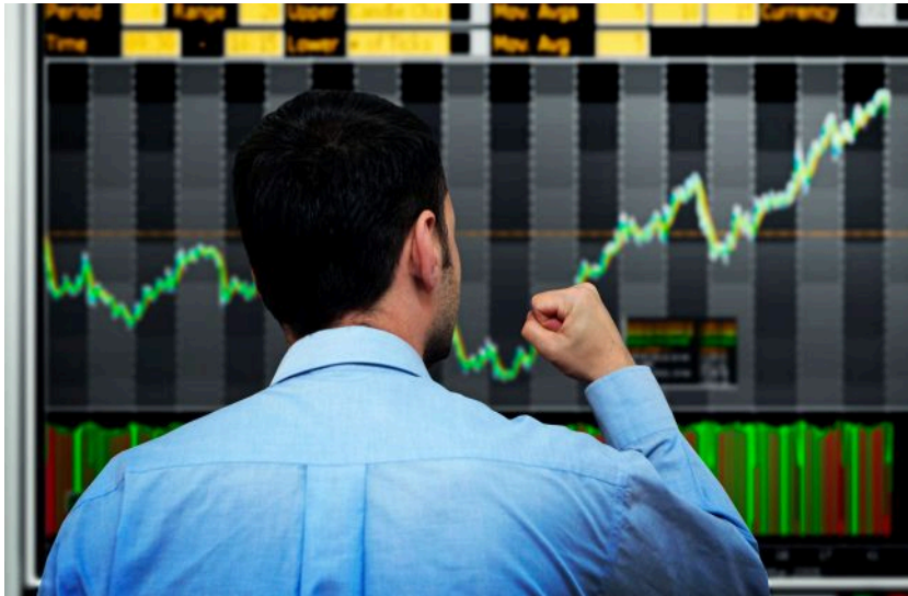
Фото: економіка РФ скоується і стане стагнації (Getty Images)