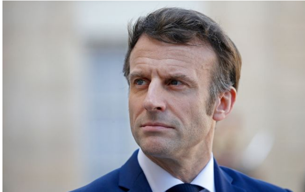
Фото: Еммануель Макрон, президент Франції (Getty Images)

Президент Франції Еммануель Макрон очікує від нового уряду Угорщини "прогресу" у питанні надання Україні кредиту ЄС на суму 90 мільярдів євро.