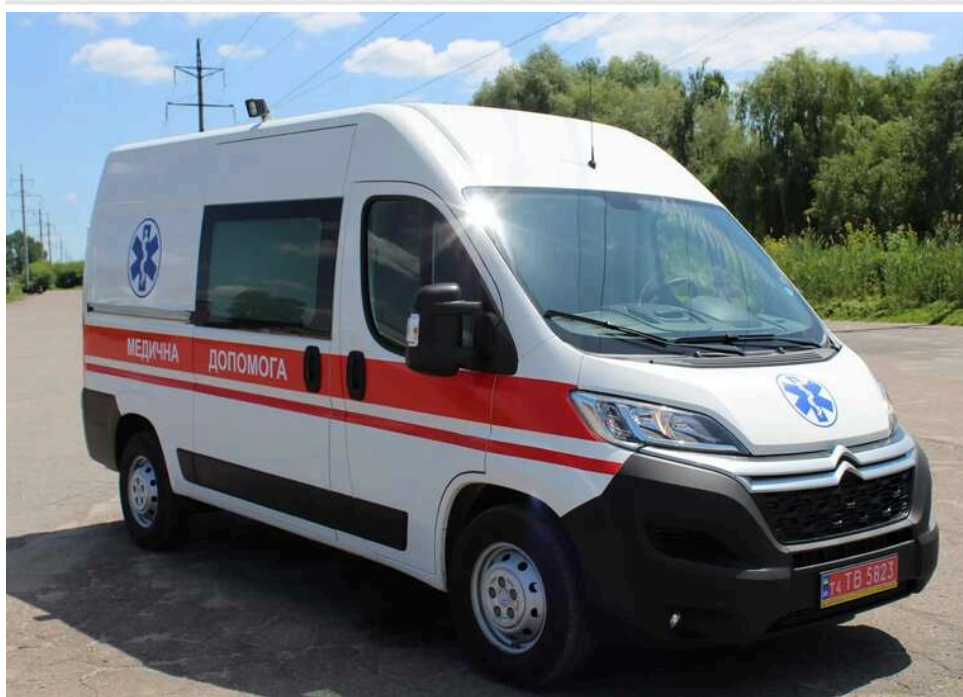
Вибух на Рівненщині: дев'ятеро людей постраждали через інцидент під час зварювальних робіт

Вибух у Городку Рівненської області стався на кордоні двох підприємств – «Кроноспана» та прилеглого об'єкта.