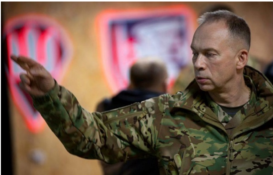
Олександр Сирський під час однієї з поїздок на фронт