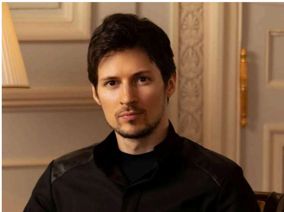
Павло Дуров заявив про «приховану цензуру» в ЄС і Великій Британії під виглядом захисту дітей

Павло Дуров стверджує, що ЄС і Велика Британія маскують цензуру в соцмережах під «захист дітей».