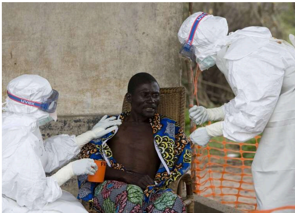
ВООЗ оголосила спалах Еболи в ДР Конго та Уганді надзвичайною подією міжнародного значення

Всесвітня організація охорони здоров'я назвала новий спалах лихоманки Ебола в Демократичній Республіці Конго та Уганді надзвичайною подією міжнародного значення.