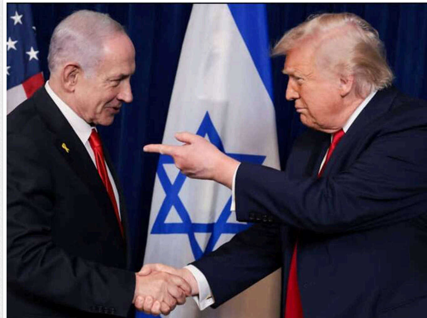
«Готові до будь-якого сценарію»: США та Ізраїль координують дії на тлі нового витка напруги навколо Ірану

Прем'єр-міністр Ізраїлю Бенямін Нетаньягу провів телефонну розмову з президентом США Дональдом Трампом, під час якої сторони обговорили можливе відновлення військових дій проти Ірану.