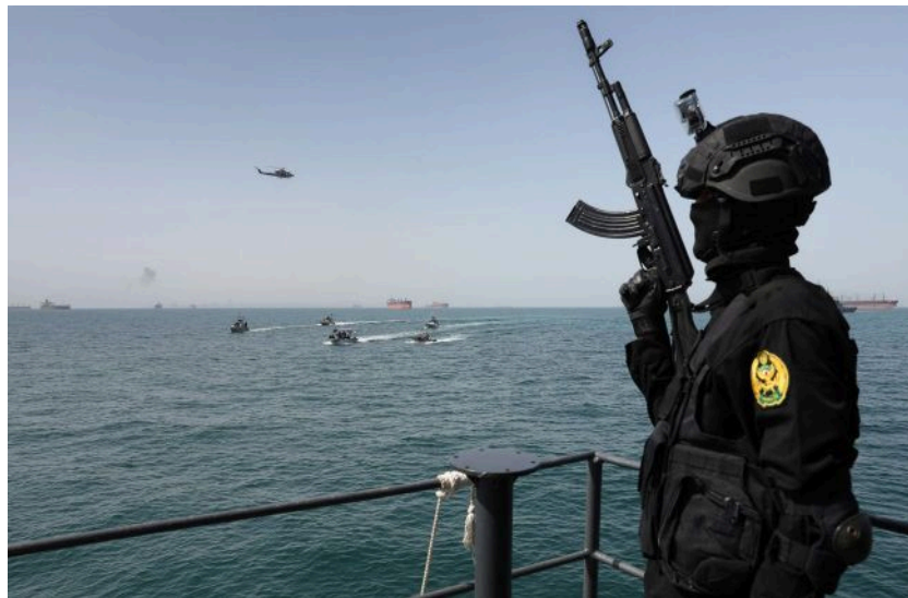
Фото: Іран погрожує брати оренду за підводні інтернет-кабелі