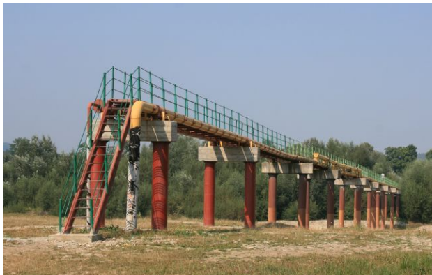
Фото: Дружба (wikipedia.org)

Прем'єр-міністр Угорщини Віктор Орбан пов'язав розблокування фінансової допомоги Україні з відновленням поставок нафти трубопроводом "Дружба". У вівторок очікуються ключові технічні випробування.