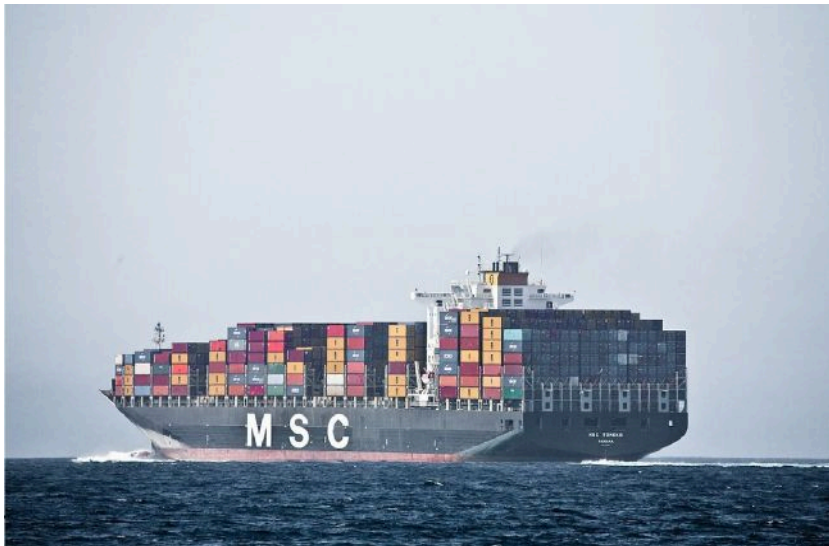
Фото: судноплавні компанії переходять на вантажівки (wikipedia.org/MSD)