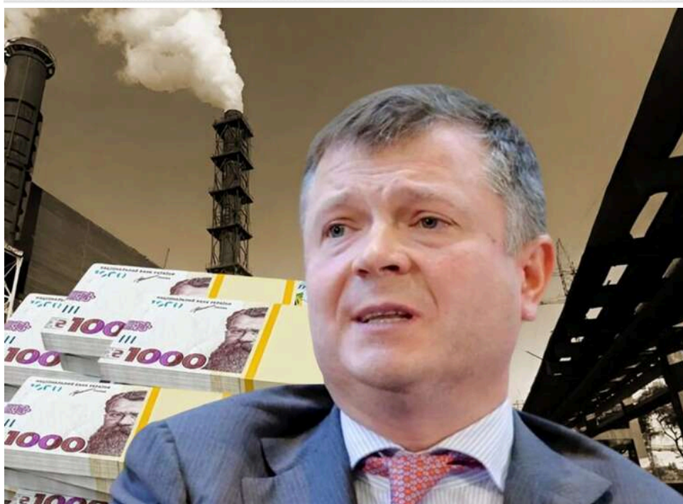
Полтавський ГЗК у заручниках олігархів: як Жеваго вивів 620 мільйонів доларів, а Крючков запускає банкрутство підприємства

Мало Полтавському ГЗКу (гірничо-збагачувальний комбінат) російських обстрілів, через які підприємство змушене періодично зупиняти роботу. Зараз воно опинилося між двох вогнів в олігархічній війні. З одного боку – нинішній власник Костянтин Жеваго, структури якого мають перед комбінатом справді шалений борг. З іншого – «кредит-хантер» Леонід Крючков, який зараз банкрутує Полтавський ГЗК і може мати зв'язки з проросійським олігархом Павлом Фуксом.