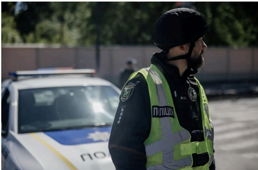
Фото: на Сумщині чоловіки намагались перевезти збитий дрон у авто, стався вибух