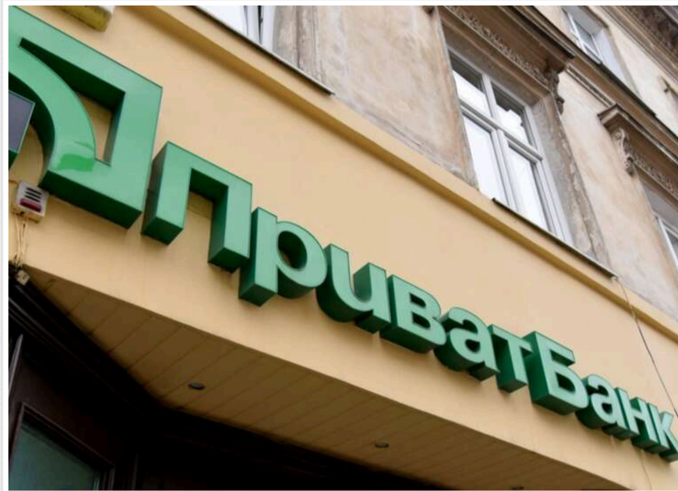
Суд підтвердив право «ПриватБанку» блокувати рахунки клієнтів за підозру в участі у гральних P2P-схемах

Читати на руском Read in English Додати як бажане джерело в Google