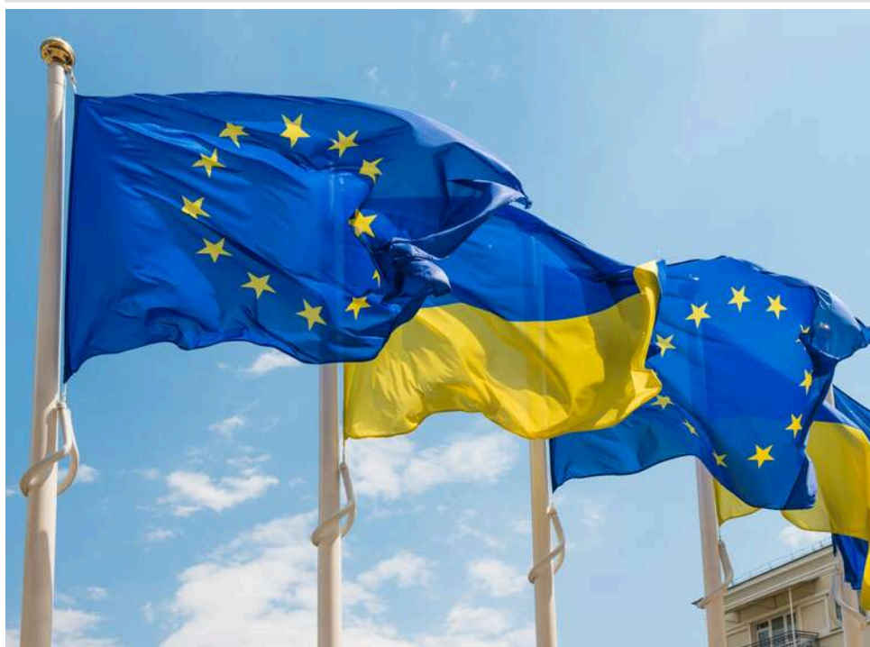
ЄС завтра затвердить умови кредиту для України на 90 мільярдів євро, – Politico

ЄС готується вже завтра затвердити умови видачі кредиту Україні в розмірі 90 мільярдів євро.