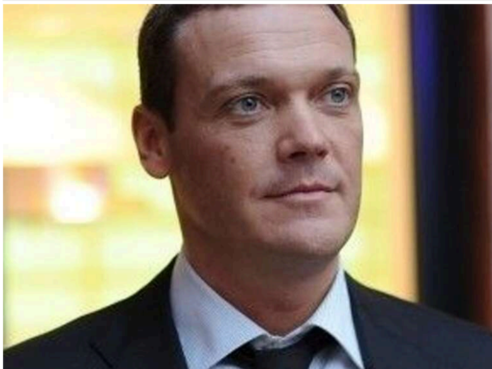
Контроль в обхід АРМА: як фармбізнес російської групи «Катрен» перейшов до орбіти Бориса Кауфмана