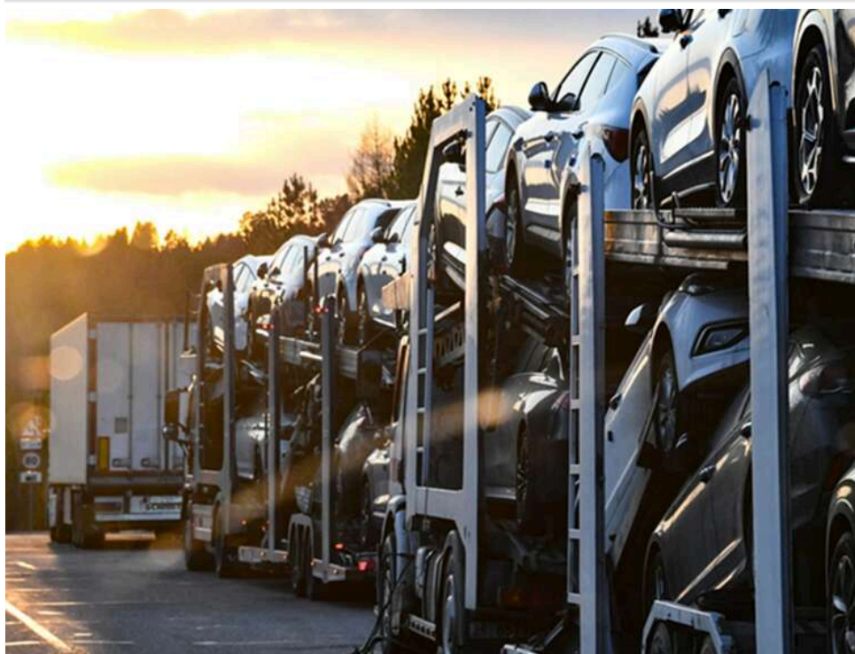
Замість фронту – заробіток: у Кропивницькому викрили схему продажу гуманітарних авто

Фортешний районний суд Кропивницького завершив розгляд справи представника громадської організації, який замість безоплатної передачі фронту ввезених із ЄС автомобілів, намагався заробити на них кілька тисяч доларів.