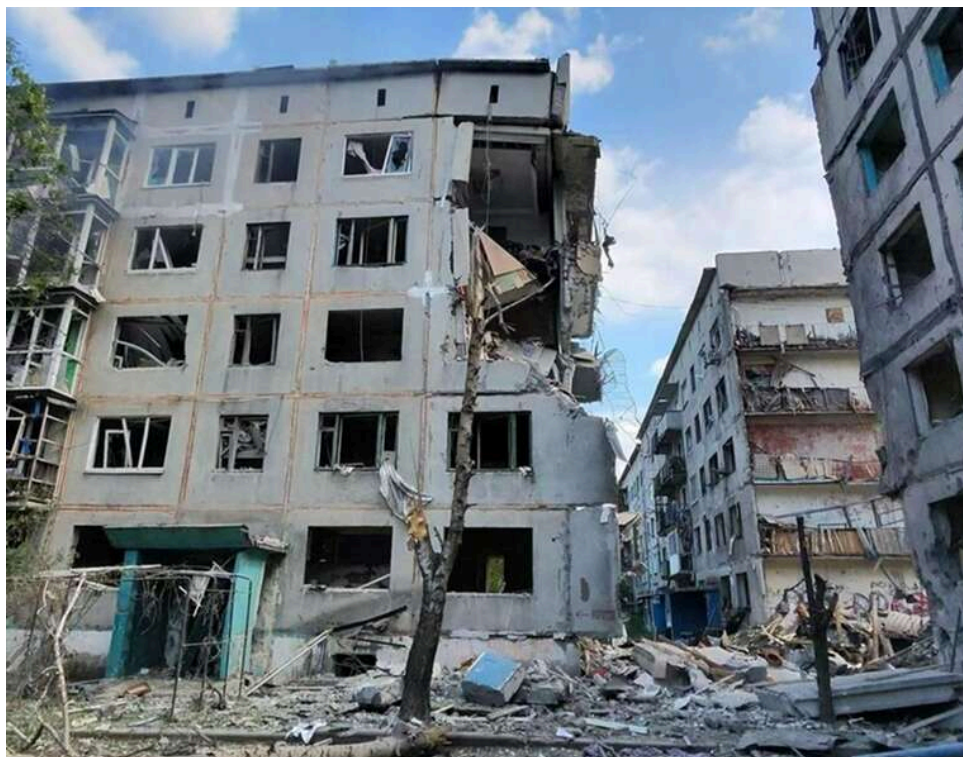
Ворожі удари по трьох районах Донецької області: є жертва, пошкоджено багатоповерхівки та підприємства

Протягом доби російські війська завдавали ударів по населених пунктах Покровського, Краматорського та Бахмутського районів Донецької області. Внаслідок обстрілів є загиблі.