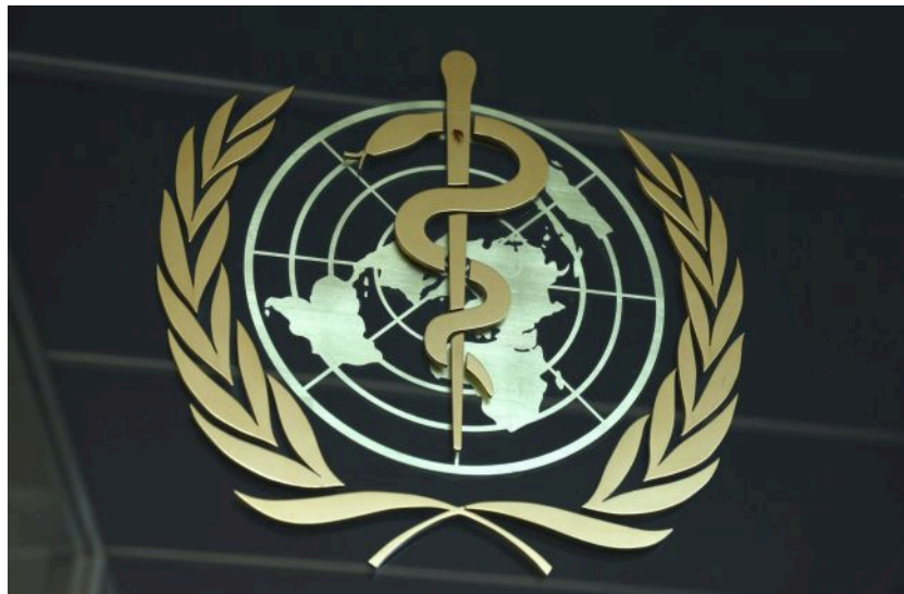
Фото: емблема Всесвітньої організації охорони здоров'я