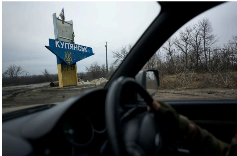
Фото: росіяни брешуть про успіхи на Харківщині