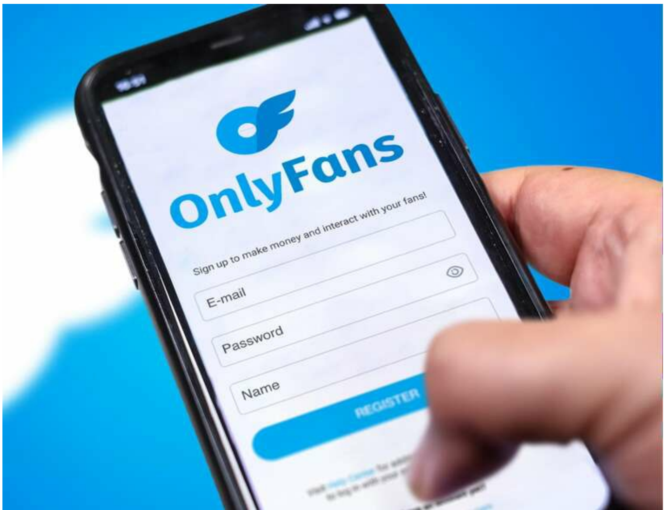
Одеська блогерка має сплатити понад 266 тисяч гривень податків та штрафів за контент на OnlyFans

Генерація матеріалів на відомій платформі – це не лише підписки та донати, а й серйозні фінансові обов’язки перед державою. Одеський окружний адміністративний суд остаточно вирішив суперечку між податковою та блогеркою.