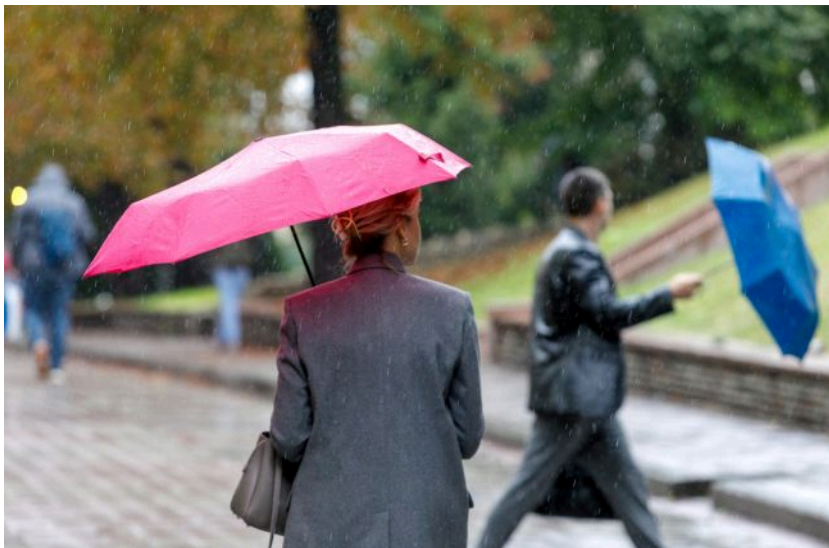
Фото: синоптики дали прогноз погоди в Україні на 17 травня