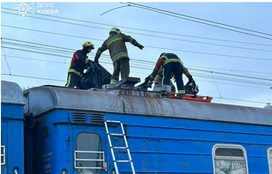
Спасатели сообщили подробности трагедии с подростками

В Киеве на крыше поезда погиб подросток, еще двое получили ожоги в результате удара током.