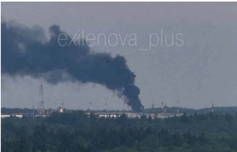
Пожежа після атаки БПЛА Московської області

У Зеленограді після великої кількості вибухів здійнялася пожежа в районі технопарку Елма. Вибухи почули і в центрі Москви. У Криму цілтю БПЛА стали військові аеродроми під Севастополем.