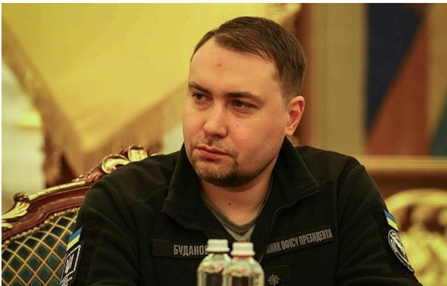
Голова ОП Кирило Буданов

Буданов погодився, що певні методи мобілізації часом виглядають недоречно, однак підкреслив, що до захисту країни мають долучатися всі.