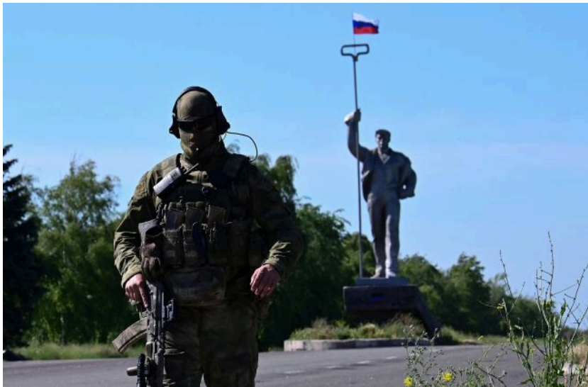
Фото: окупація Маріуполя