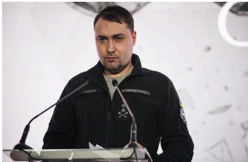
Фото: очільник голови ОП Кирило Буданов (Getty Images)