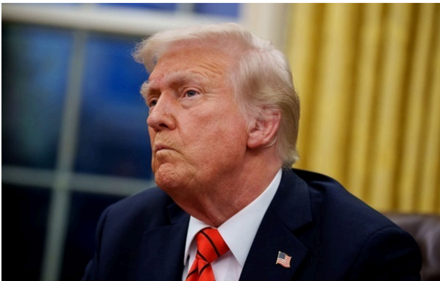
Президент США Дональд Трамп

Президенту США належить вирішити, чи є нанесення нових ударів по Ірану найкращим варіантом для припинення конфлікту.