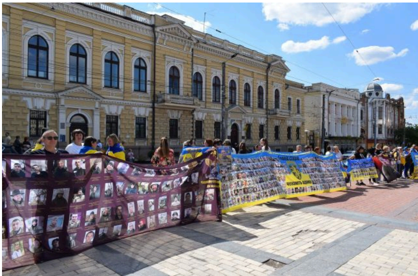
Фото: стяг з портретами полонених