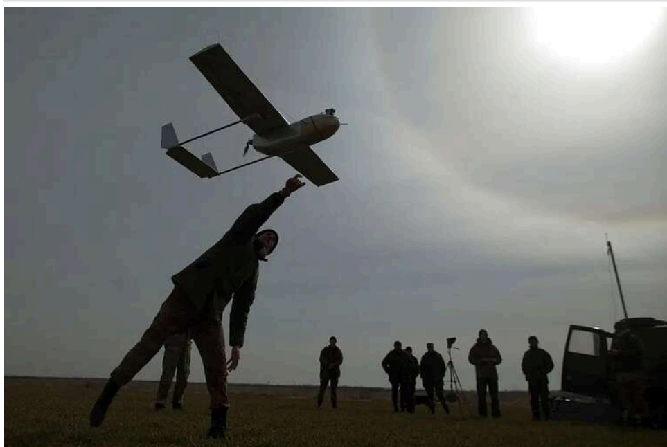
Пункти управління, техніка та удари по Рязанському НПЗ: у Генштабі повідомили про успішні ураження об'єктів ворога

Протягом минулої доби та в ніч проти 16 травня 2026 року підрозділи Сил оборони України завдали ударів по низці важливих об'єктів російських окупантів.