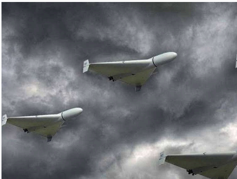
Окупанти атакують Україну "шахедами"

Увечері суботи, 16 травня, російські війська атакували Україну ударними безпілотниками.