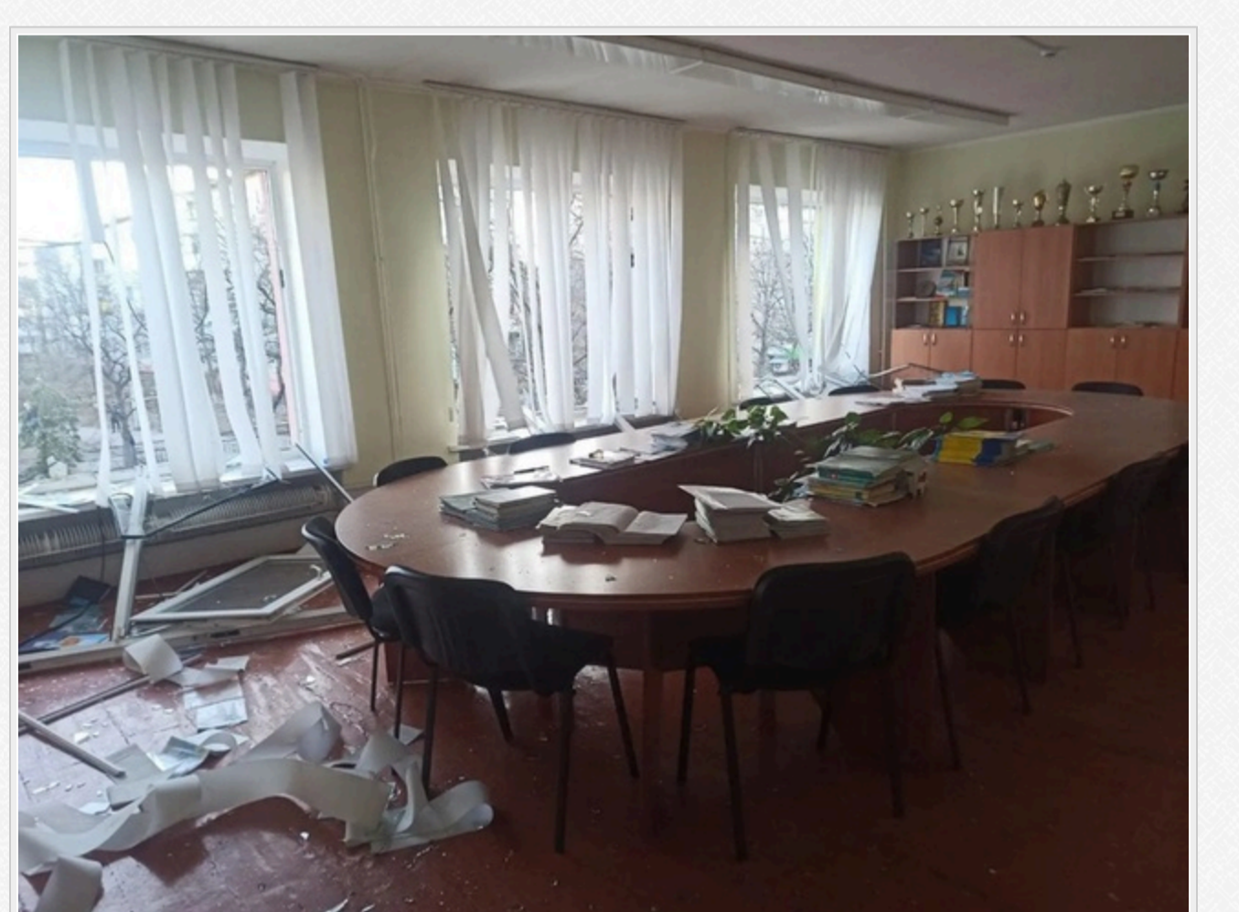
На фото: руйнування Академічного ліцею №1 в Україні

За даними аналітичної системи Youcontrol, ТОВ «Гарантбуд Українка» зареєстрували у червні 2025 року в місті Українка. Статутний капітал складає 8 тис. гривень. Основний вид діяльності – інші роботи із завершення будівництва.