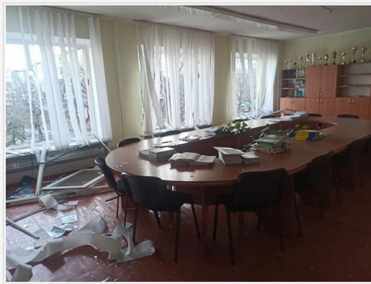
На фото: руйнування Академічного ліцею №1 в Україні

За даними аналітичної системи Youcontrol, ТОВ "Гарантбуд Українка" зареєстрували у червні 2025 року в місті Українка. Статутний капітал складає 8 тис. гривень. Основний вид діяльності – інші роботи із завершення будівництва.