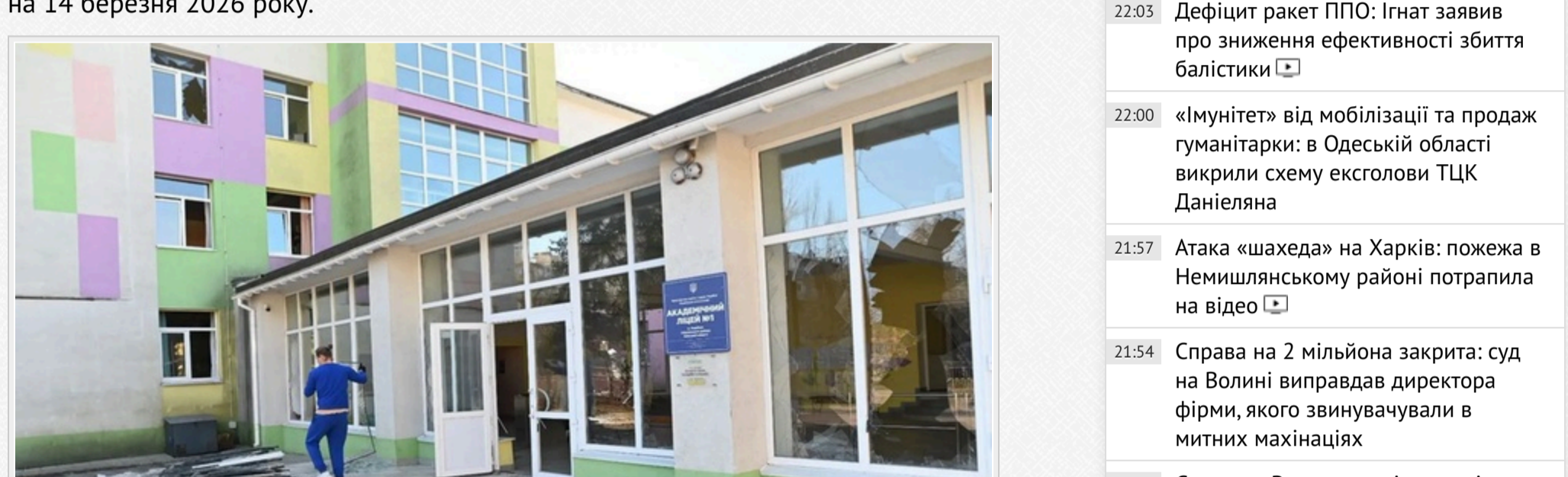
На фото: руйнування Академічного ліцею №1 в Україні (джерело – сторінка у Facebook Оксена Лісового)

За даними аналітичної системи Youcontrol, ТОВ "Гарантбуд Українка" зареєстрували у червні 2025 року в місті Українка. Статутний капітал складає 8 тис. гривень. Основний вид діяльності – інші роботи із завершення будівництва.