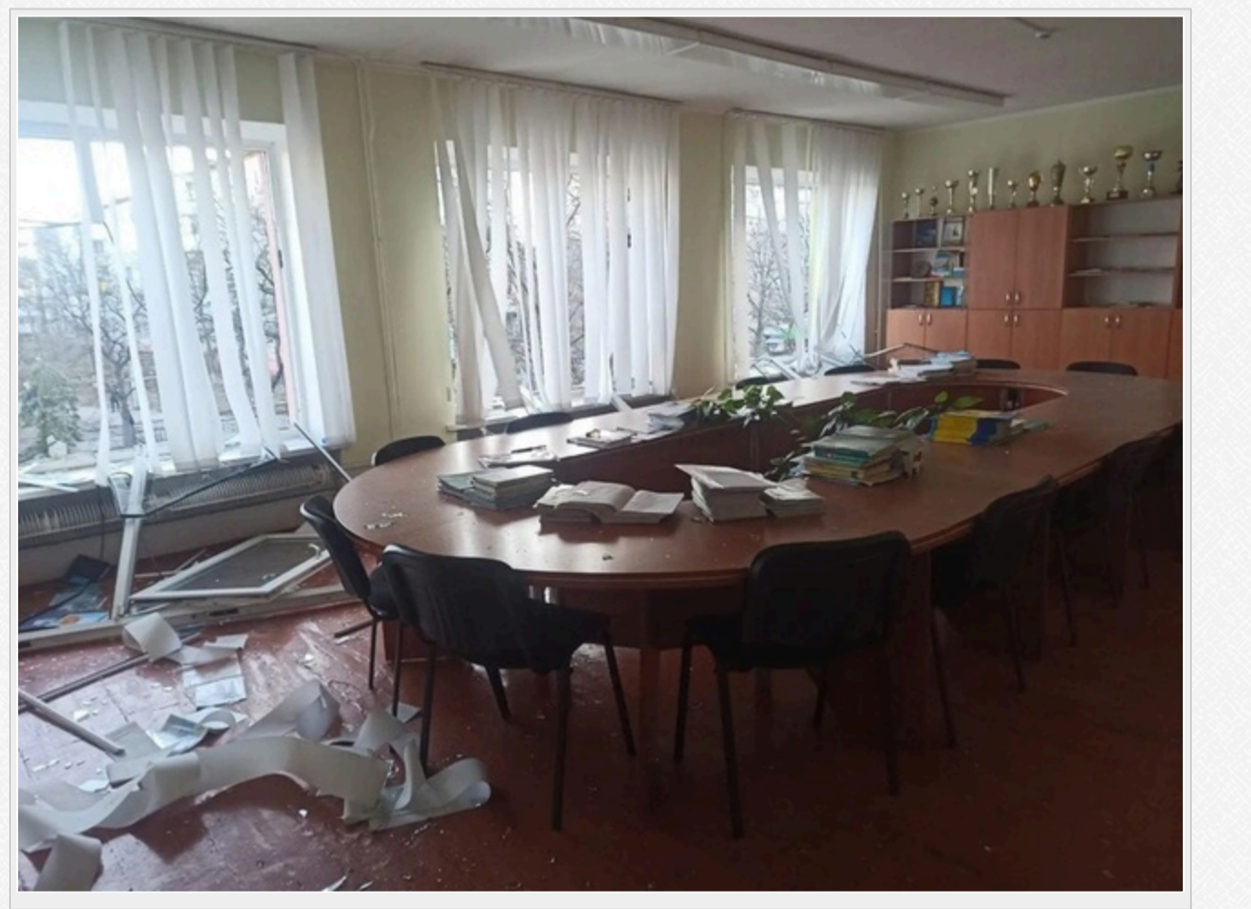
На фото: руйнування Академічного ліцею №1 в Україні

За даними аналітичної системи Youcontrol, ТОВ "Гарантбуд Українка" зареєстрували у червні 2025 року в місті Українка. Статутний капітал складає 8 тис. гривень. Основний вид діяльності – інші роботи із завершення будівництва.