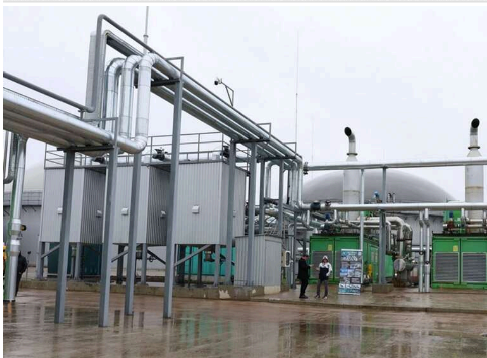
Від Курченка до Фірташа: чому конкурс у «Газорозподільних мережах України» опинився в центрі скандалу навколо Скиби