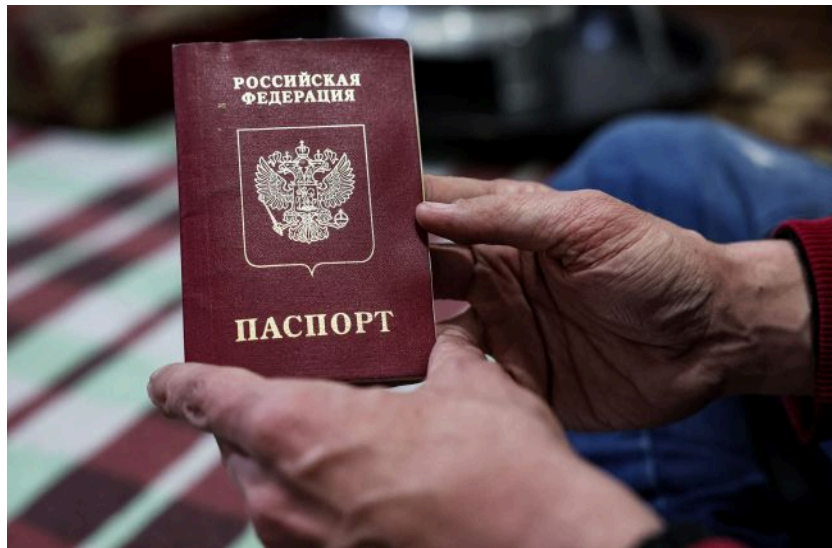
Фото: паспорти РФ у Придністров'ї