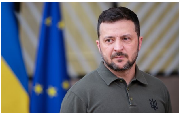
Фото: Володимир Зеленський (Gettyimages)

В Естонії частина політиків різко відреагувала на слова Володимира Зеленського, заявивши про повторення російських наративів і можливе ускладнення союзницького діалогу.