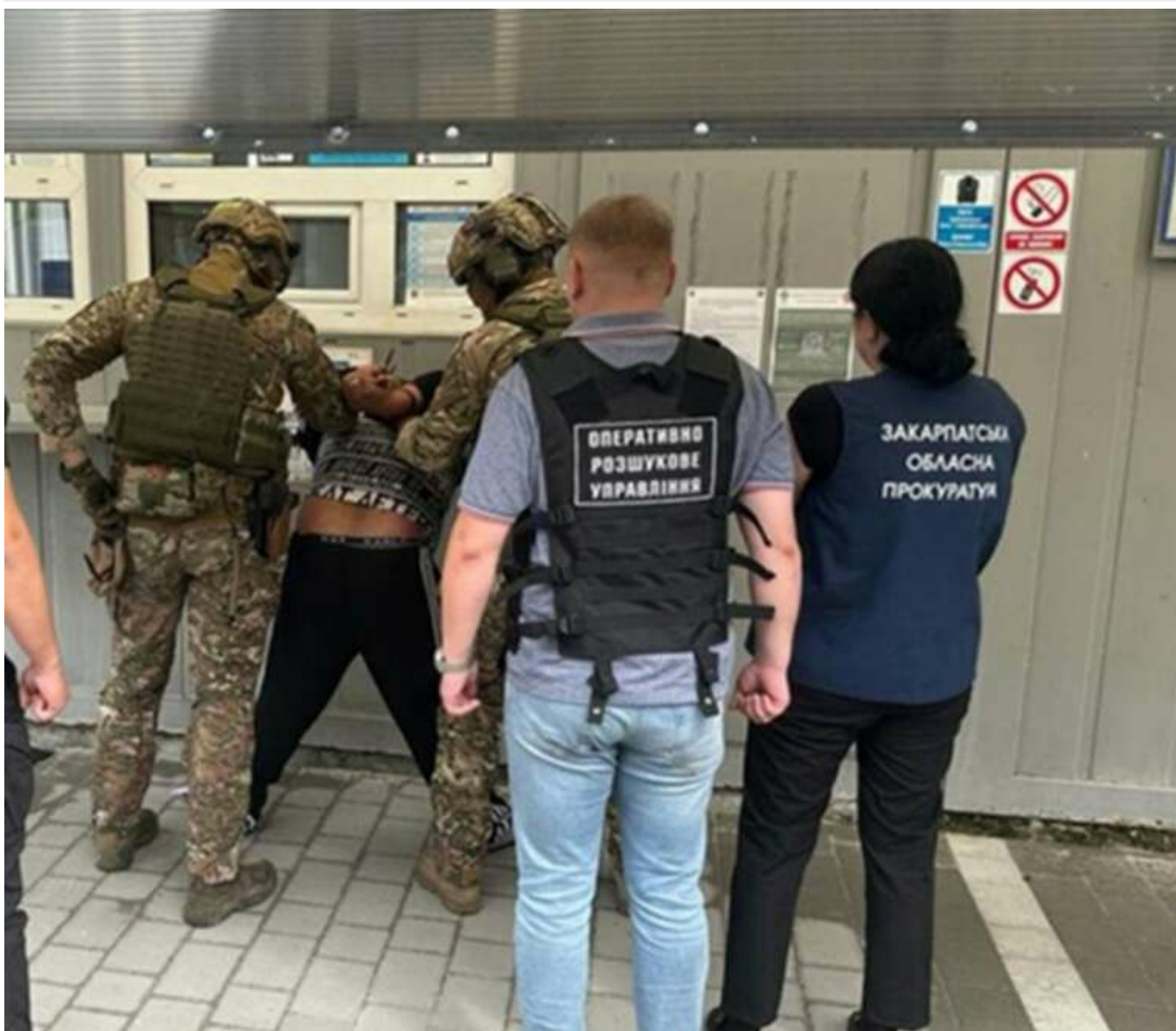
10 років ув'язнення: На Закарпатті засудили вихователя за спробу продати 10-місячне немовля

На Закарпатті колишнього вихователя інтернату засудили до 10 років ув'язнення з конфіскацією майна. Чоловік намагався нелегально продати 11-місячного хлопчика до Іспанії.