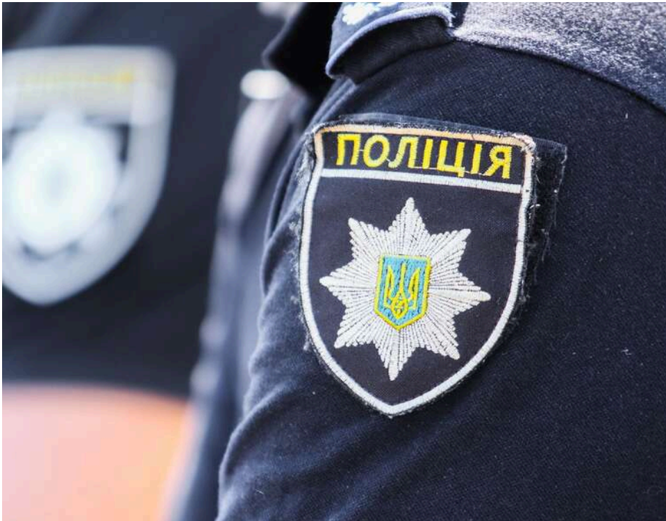
Напад на поліцейське авто в Одесі: підозрюваний виявився сином місцевих посадовців

Сімнадцятирічний одесит, який розбив поліцейський автомобіль під час бусифікації, виявився сином високопоставлених чиновників.