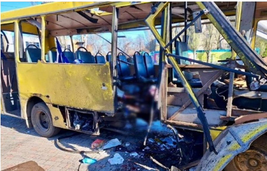
Росіяни вдарили по автобусу у Нікополі

Окупанти атакували FPV-дронем міський автобус у самому центрі Нікополя. Три людини загинули та ще дванадцять дістали поранення.