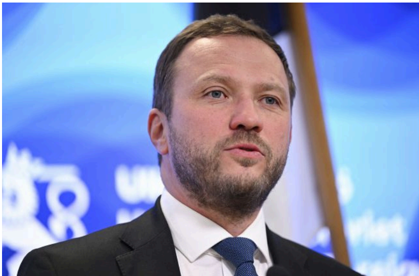
Фото: міністр закордонних справ Естонії Маргус Цахкна