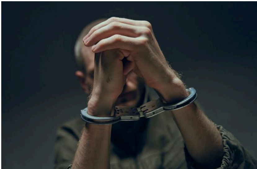
Фото: на Закарпатті засудили колишнього вихователя інтернату