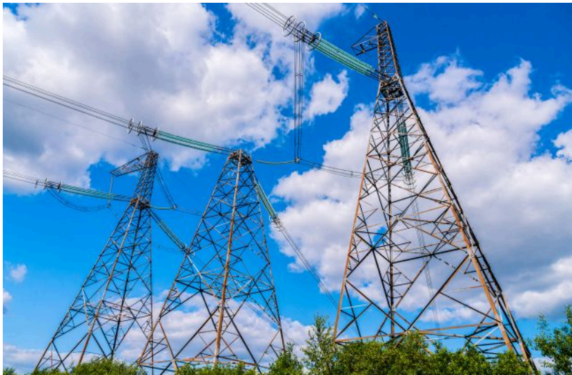
Енергоринок накопичив сотні мільярдів гривень боргів