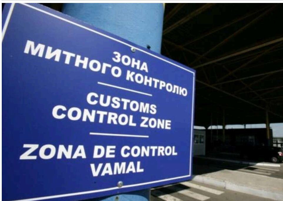
Штраф за «медові» хабарі: у Кропивницькому засудили митника, який брав по 200 доларів за сертифікат на експорт

Отримувач хабарі за сертифікати на мед: у Кропивницькому засудили митника.