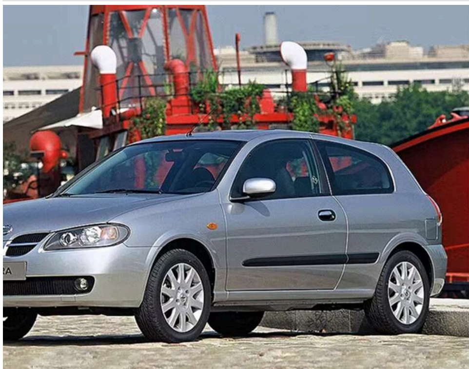
Транзит тривалістю в 10 років: у Чернігові суд конфіскував авто, яке ввезли ще у 2015 році

«Євробляха» з непростю долею: у чернігівця конфіскували авто, яке він «забув» вивезти ще 10 років тому.